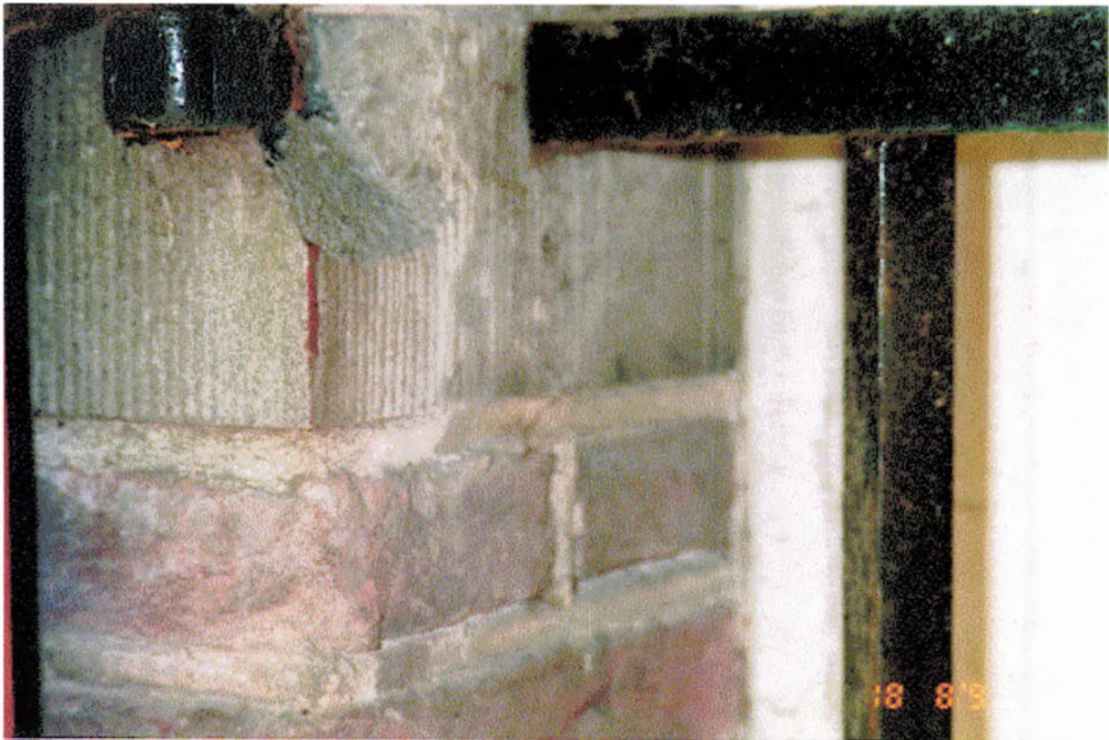
W0143-01 Afgebroken hoek uit duimblok