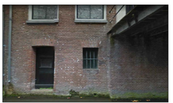
Vooraanzicht werfkelder