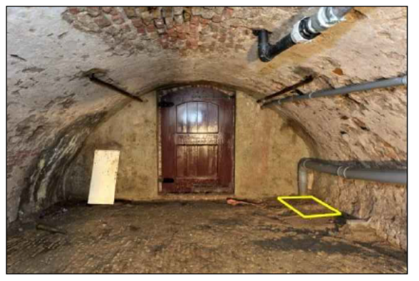
Foto werfkelder binnen